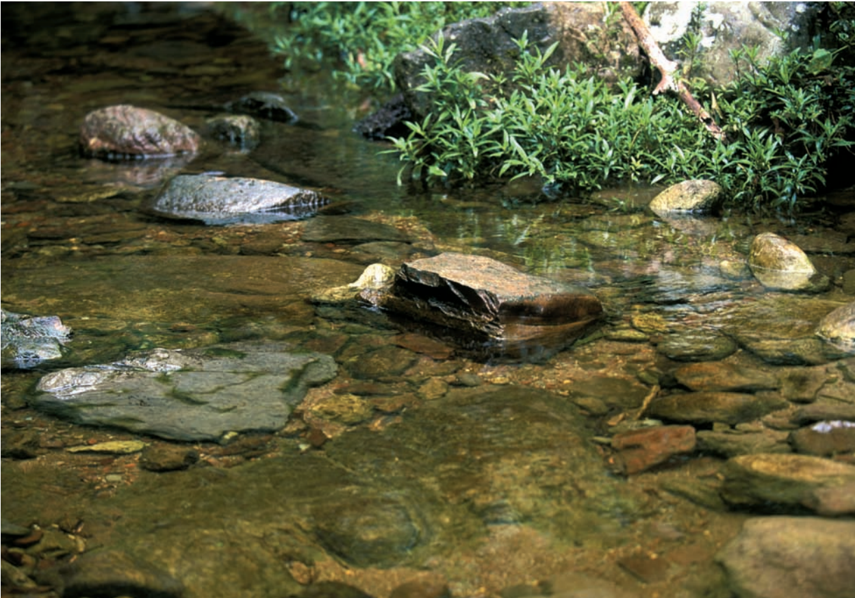
Abb. 4: Fundort von Knodus pasco sp. n. Erste Quebrada bei San Antonio de Cacazú (eigentlich nach dem Vorort Baja Cacazú) auf der Straße nach Puerto Bermúdez.

bei K. geryi ) und (3) der Färbung unterscheiden. Ein dunkles Längsband befindet sich in der Dorsale von K. pasco sp. n., die Dorsale von K. geryi ist dagegen farblos. K. pasco sp. n. besitzt keine symmetrischen dunklen Punkte auf der Basis der Flossenlappen der Caudale, die bei K. geryi vorhanden sind. Das dunkle Längsband beginnt bei K. pasco sp. n. in seiner vollen Intensität direkt hinter dem Kiemendeckel, bei K. geryi erlangt es seine volle Ausprägung dagegen erst unterhalb der Dorsale. Bei K. pasco sp. n. erscheint das Band dadurch auch breiter als bei K. geryi . K. pasco sp. n. verfügt über einen schwarzen Rand in der Anale, der K. geryi fehlt. Hinzu kommt, dass die Anzahl der Schuppen der Seitenlinie und der geteilten Afterflossenstrahlen zwar überlappen, jedoch jeweils in die andere Richtung tendieren: