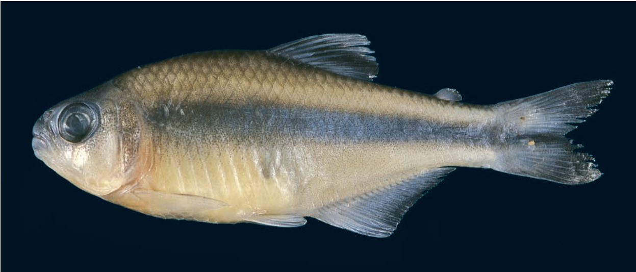
Abb. 1: Knodus pasco sp. n., 52,6 mm SL, Paratypus, Seitenansicht, MTD F 30635.

während SCHULTZ (1944), BÖHLKE (1958), THAPHORN (1992) sowie ROMÁN-VALENCIA (2000) davon ausgehen, dass die in ihr zusammengefassten Arten in der Gattung Bryconamericus EIGENMANN, 1907 (Typusart: Bryconamericus exodon EIGENMANN, 1907) zu führen sind. LIMA, BRITSKI & MACHADO (2004) halten es jedoch für das Beste bis zum Vorliegen einer allseits befriedigenden phylogenetischen Diagnose den Status quo beizubehalten. Die Auffindung unterschiedlicher Fortpflanzungsstrategien bei den gegenwärtig in der Gattung Knodus zusammengefassten Arten (sowohl Taxa mit innerer als auch mit äußerer Befruchtung, BURNS & WEITZMAN, 2005) deutet weiterhin stark auf einen paraphyletischen Zustand dieser Gattung hin; zumindest was wir momentan unter der Gattung Knodus verstehen. Aufgrund dieser Tatsache und der zahlreichen, noch unbeschriebenen Arten (z.B. LIMA, BRITSKI & MACHADO, 2004; FERREIRA & LIMA, 2006; ZARSKÉ & GÉRY, 2006), die der gegenwärtigen Definition dieser Gattung entsprechen, ist dieses pragmatische Vorgehen sicherlich die beste Lösung. Ermöglicht es doch unabhängig von dem Vorliegen einer phylogenetischen Analyse die Klärung einzelner, der überaus zahlreichen, gegenwärtig existierenden, taxonomischen Probleme. So fing H. BLEHER während einer Sammelreise in Peru eine interessante, neue Form, die nachfolgend wissenschaftlich beschrieben wird.