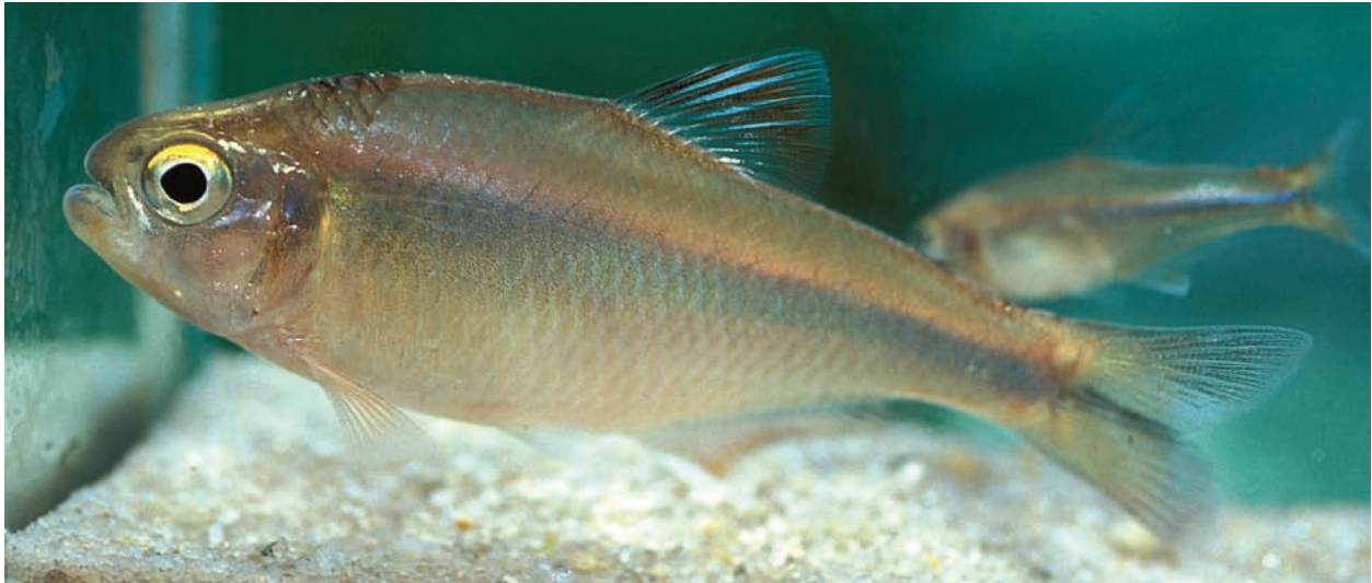
Abb. 3: Knodus pasco sp. n., Lebendfärbung kurz nach dem Fang.

ein gleichfarbiger Fleck. Dorsale mit einem breiten schwarzen Längsband, welches auf den Membranen liegt und aus dem blau irisierend die eigentlichen Flossenstrahlen hervorstechen.